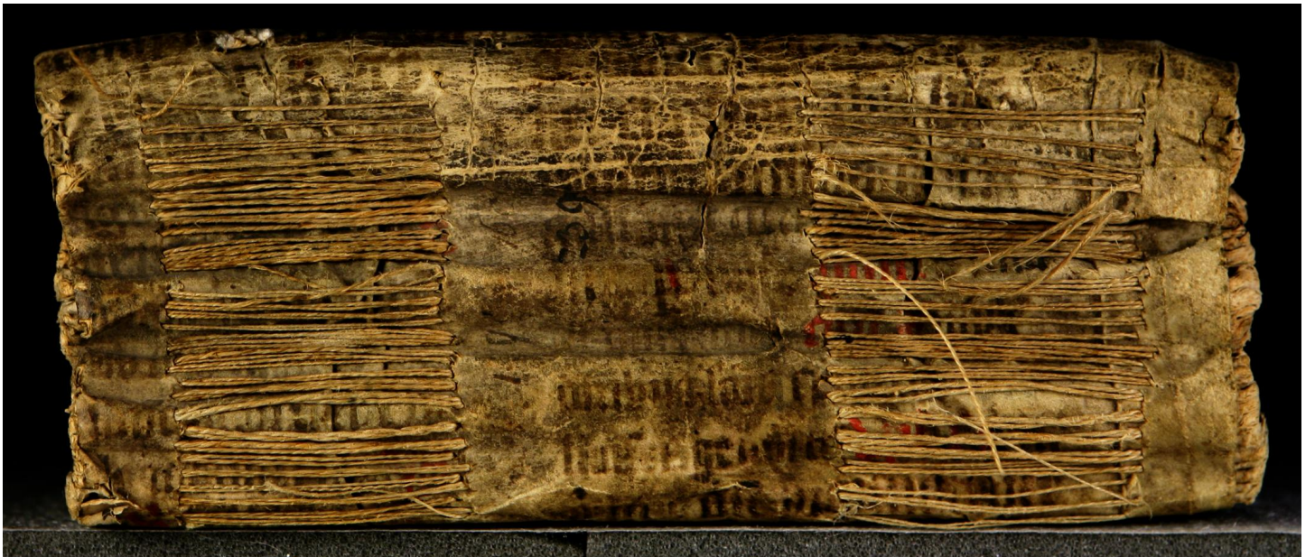
LN 588 8°